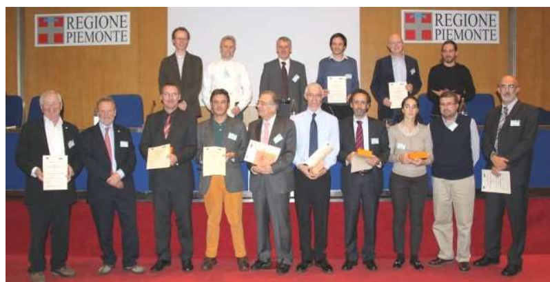
eSDINet+ Awards: les représentants des 12 IDG à Turin en novembre 2009.