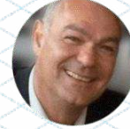
Yves MEO Usages-Utilisateurs Aix-Marseille-Provence Métropole