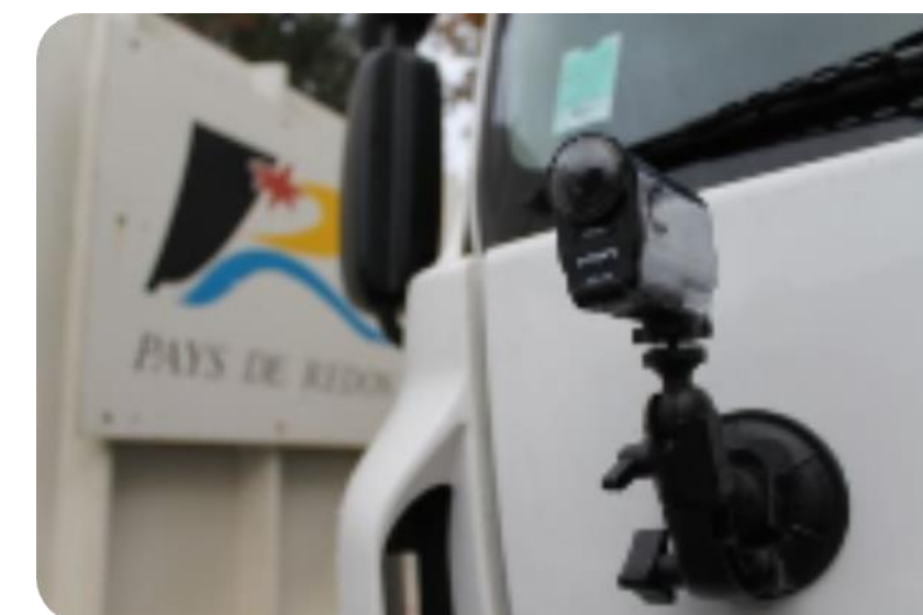
Caméra installée sur les camions de récupération des déchets à Redon