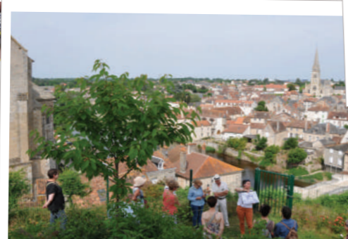
Comprendre l'histoire des lieux