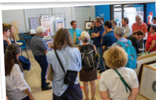
Les cartes s'exposent