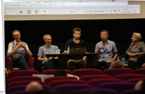
Débater et croiser les expériences