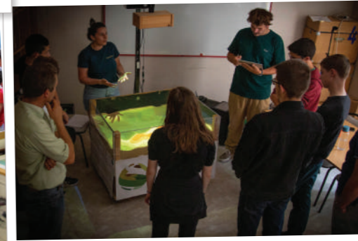
Partager les sciences