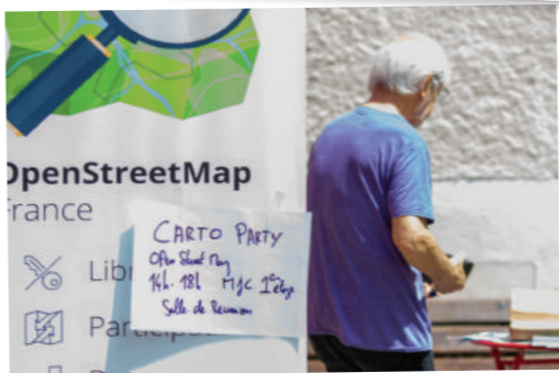
Outils cartographiques citoyens