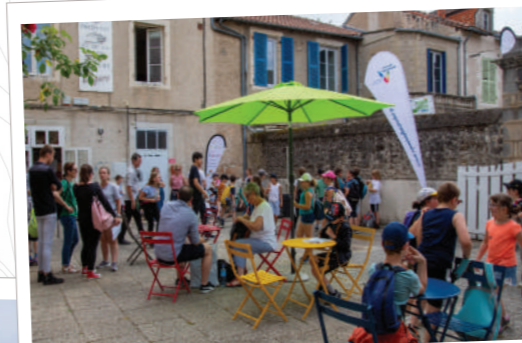
Un festival à taille humaine