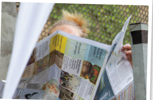
4 jours de découverte !