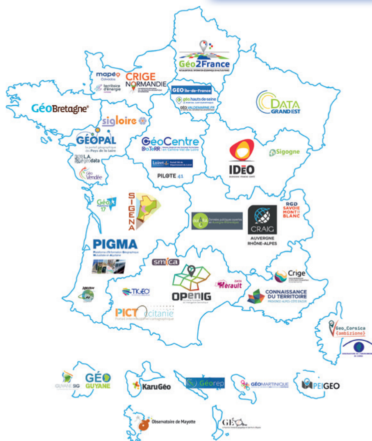
Figure 1. Aperçu des plateformes de données géographiques à vocation régionale ou départementale (sur la base de l'enquête réalisée en 2022).

D'un côté, l'impact du numérique sur l'empreinte carbone nationale augmente de manière exponentielle. D'un autre, la donnée est devenue un outil de gouvernance qui est utilisé pour aider à la décision sur des sujets stratégiques et garantir la transparence des décisions. Dans ce nouveau cadre en pleine transition, les plateformes territoriales doivent redéfinir leur vision pour modifier le positionnement purement géomatique vers une gestion de la donnée au sens large. Ces stratégies nécessitent l'adhésion et le soutien du politique local et national, ainsi que le dialogue avec l'écosystème de la donnée, la société civile et les usagers.