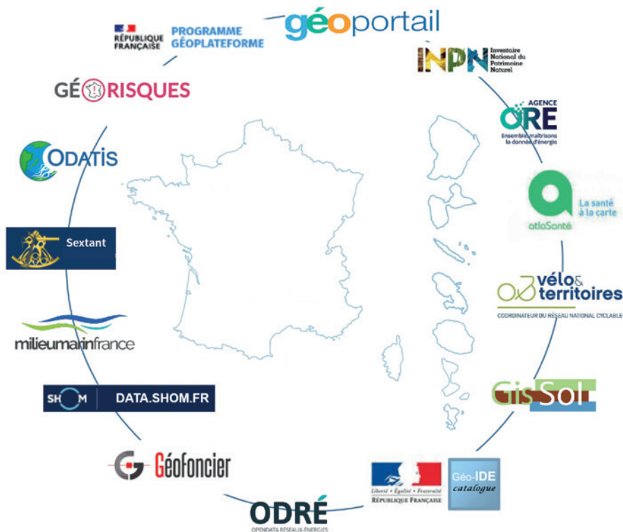
Figure 2. Aperçu des plateformes de données géographiques à vocation nationale.

L'enquête a également permis de mettre en avant des points d'attention suite aux échanges avec les plateformes. L'un de ceux-ci est lié à l'exploitation des données : les plateformes recommandent la standardisation des données et y travaillent activement au sein des groupes de travail via l'Afigeo. Un second est lié à la fragilité économique sur le long terme des existants et les plateformes militent pour un engagement des partenaires locaux et nationaux sur la durée afin de sécuriser la donnée et sa mise à disposition en cohérence avec les territoires. Le rapport fait état de grands axes de perspectives ou d'enjeux à venir :