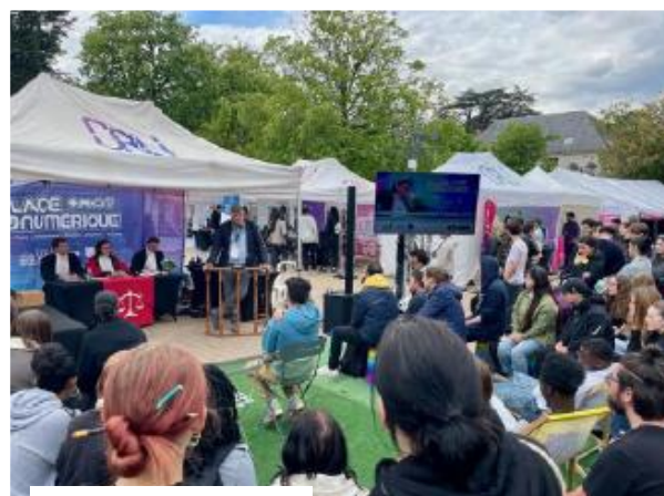
Place du Numérique