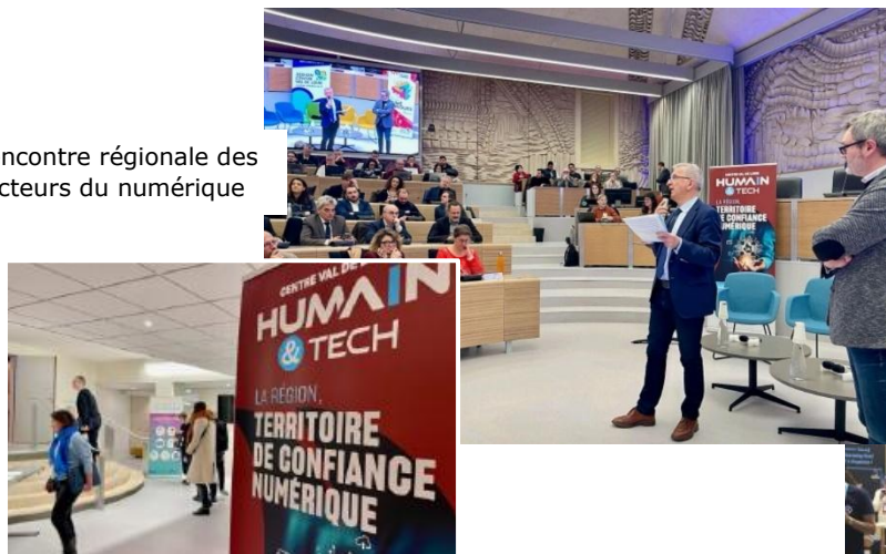
Rencontre régionale des acteurs du numérique