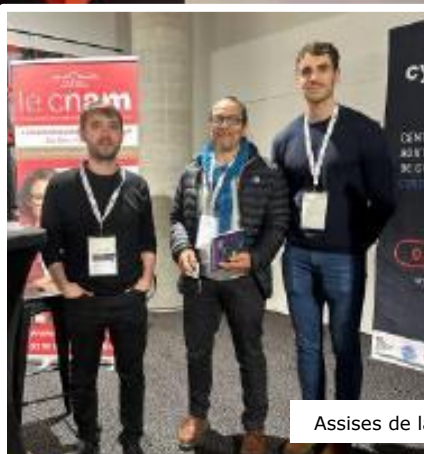
Assises de la cyber : gagnants du CTF