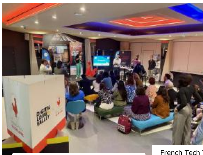
French Tech Tour