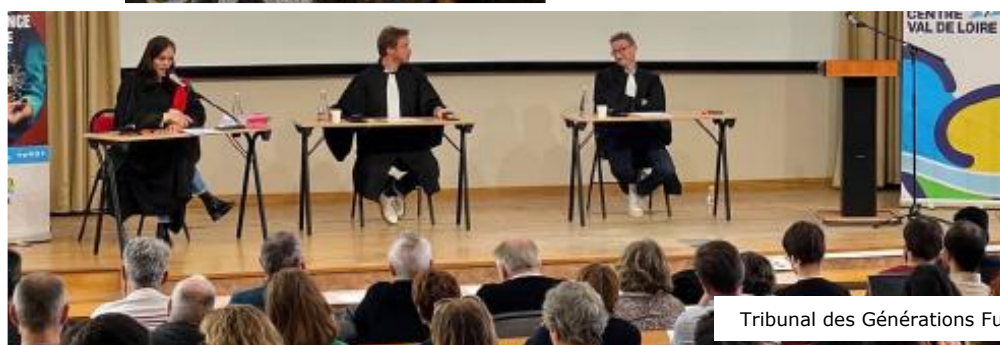
Tribunal des Générations Futures